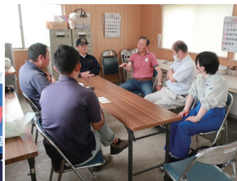
沖宿にて蓮田の被害について意見交換