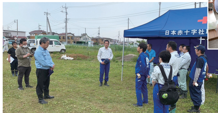
取手市の状況視察